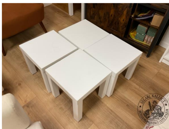
n°18 1 ex. Table bois coloris blanc