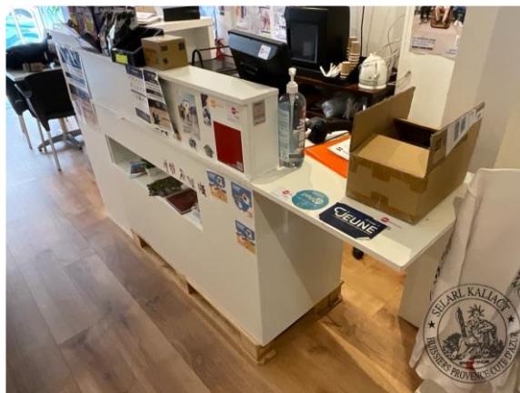
n°12 1 ex. Cafetière PHILIPS