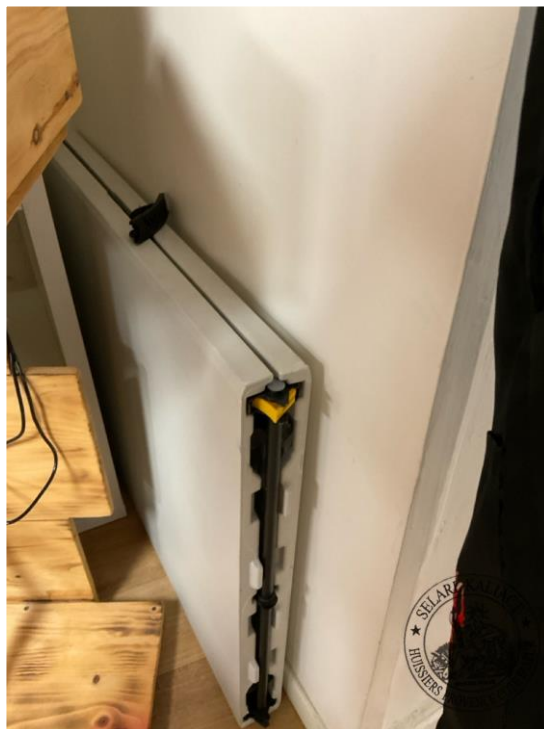
n°17 6 ex. Table basse bois mélaminé coloris blanc